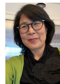
Hiromi Blomberg Japan Business & Innovation Hub