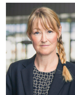
Ofelia Madsen Japan Bridge Scandinavia